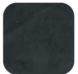
ÜRÜN KODU: SİYAH