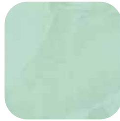
ÜRÜN KODU: ÇAĞLA