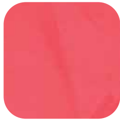
ÜRÜN KODU: KIRMIZI