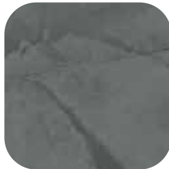
ÜRÜN KODU: KOYU GRİ