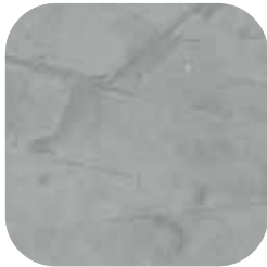
ÜRÜN KODU: AÇIK GRİ