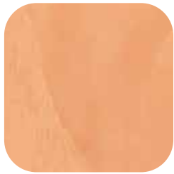
ÜRÜN KODU: TOPRAK