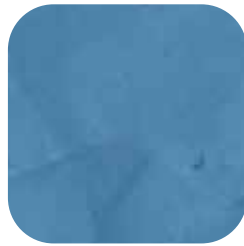
ÜRÜN KODU: MAVİ