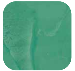
ÜRÜN KODU: YEŞİL