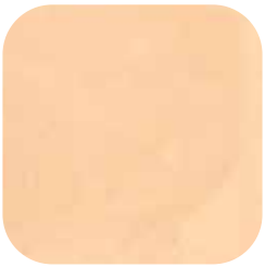
ÜRÜN KODU: BEJ